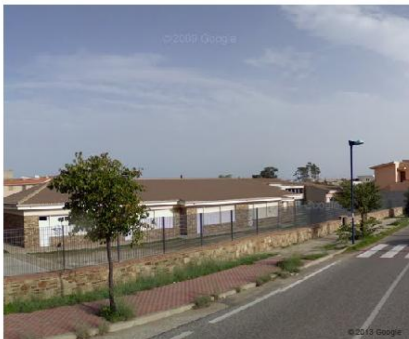
Foto 1. Struttura

Qui sotto si propone una immagine fotografica della struttura e nella pagina successiva lo stralcio planimetrico della zona di sedime dell'edificio.